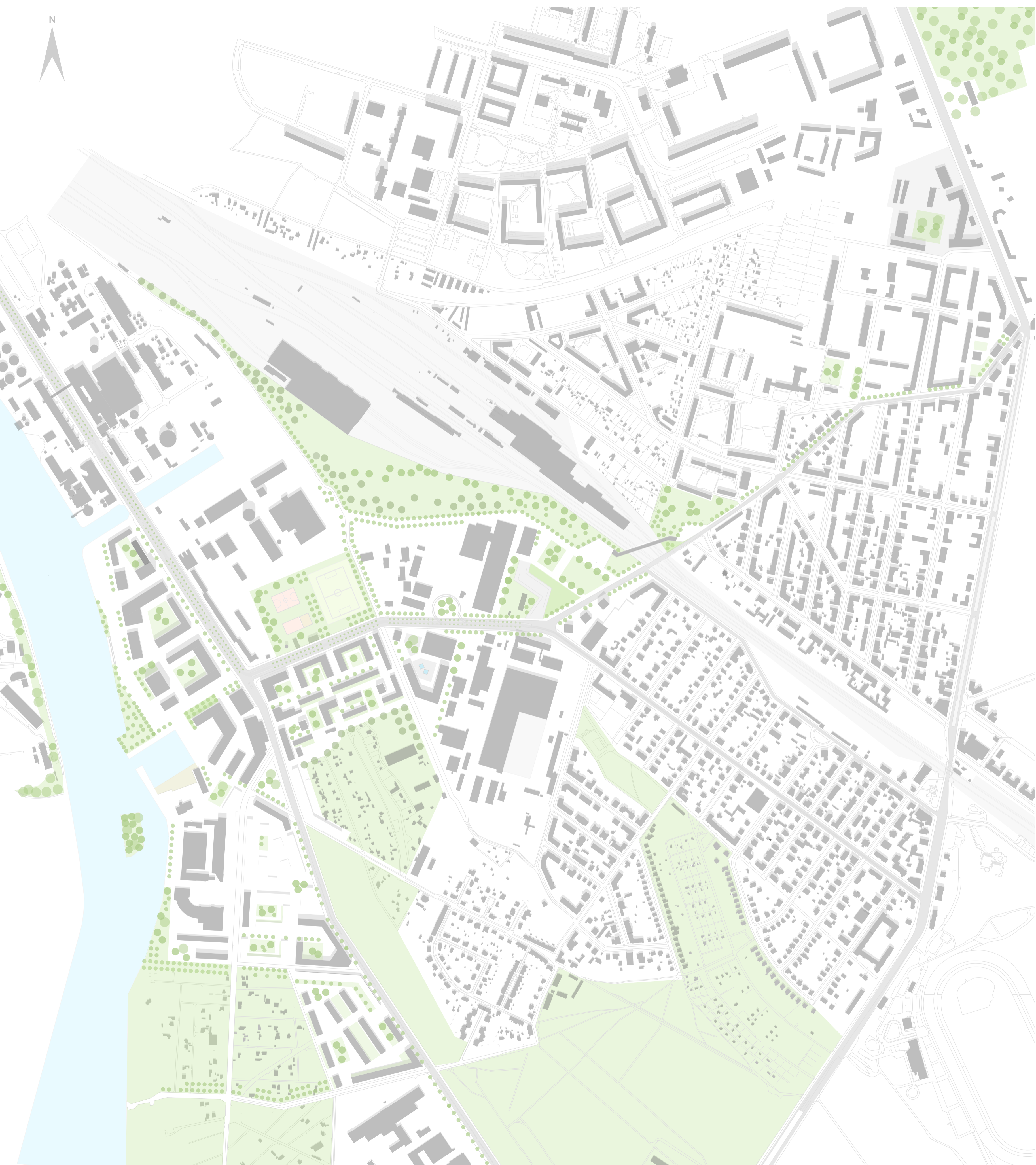
Lageplan M 1:5000