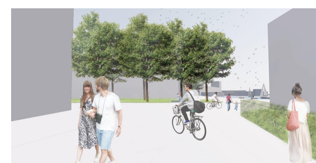
Blick zum Hafenbecken

Blockdammerweg Der Blockdammerweg wird über die Bahngleise hinaus sowohl für den Verkehr als auch für Fußgänger und Radfahrer über den Karlsruher Park zur Quartiersübergreifenden Verbindungsachse ausgebildet. Das Spreeufer wird zugänglich gemacht und entlang des Blockdammerwegs werden eine Reihe von Öffentlichen Plätze und Parks aktiviert. Durch die Schaffung von Begegnungszonen an Markante Punkte wird diesem bisherig Industriell Geprägtem Gebiet eine neue Identität verliehen.