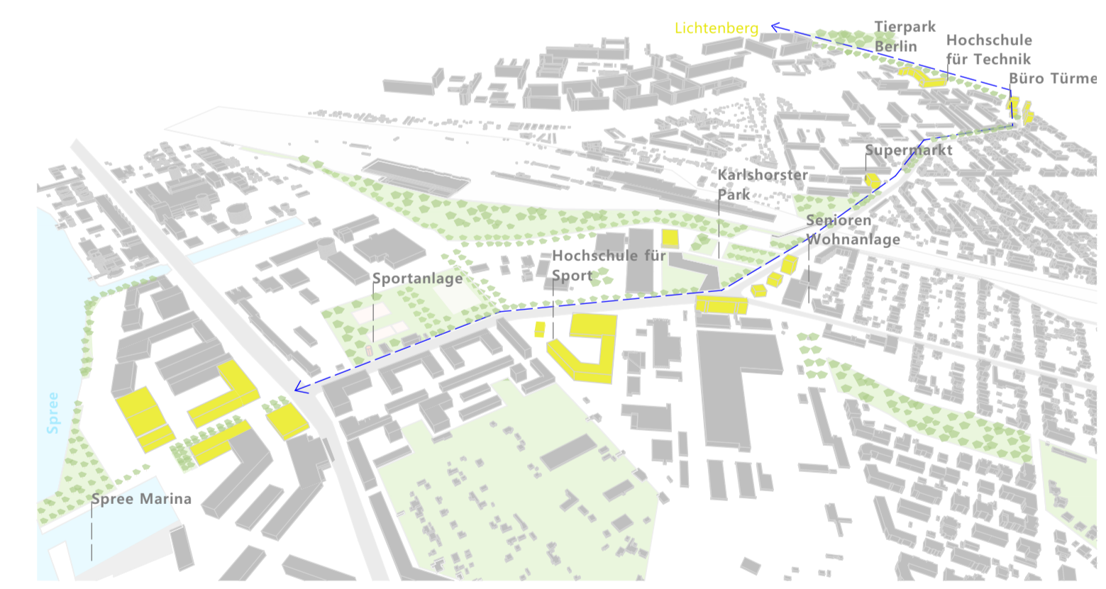
Konzept: Verbindungsachse Blockdammerweg nach Lichtenberg

Köpenicker Chaussee Durch die Analyse des Entwurfsgebietes, hat sich gezeigt, dass sich entlang der Köpenicker Chaussee eine Reihe verborgene Attraktive Orte befinden. Durch den gezielten Einsatz von Gebäudebausteinen an den Knotenpunkten dieser Achse soll auf diese Orte hingedeutet werden und eine bessere Zugänglichkeit von der Köpenicker Chaussee zu den jeweiligen Attraktionen, wie z.B der Rennbahn, dem Bootsanlegeplatz oder der Waldsiedlung verdeutlicht werden. Dies schafft in dem Gebiet eine bessere Orientierung und den Orten eine klare Identität.