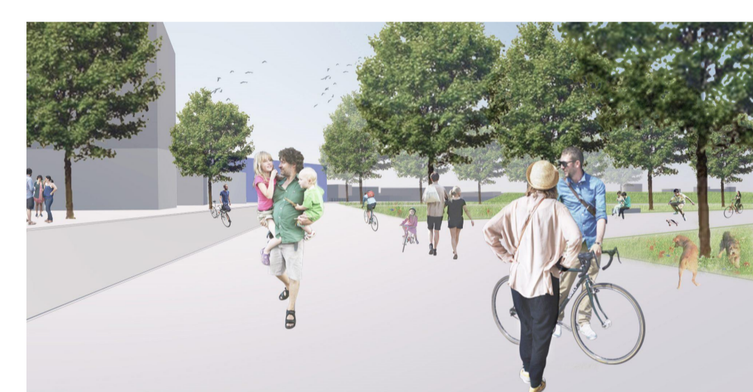
Blick in den Park am Blockdammerweg

Hochschule München, Fakultät für Architektur Schlüsselkompetenz Teilmodul 2 CAD WS 14/15 LB Frau Lotter Maroua Nefzi